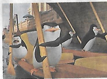
20th Century Fox